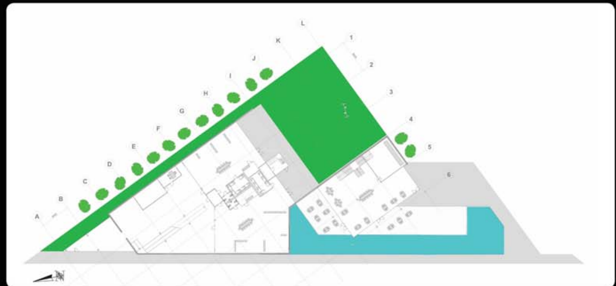
PL.GR. BEGANE GROND