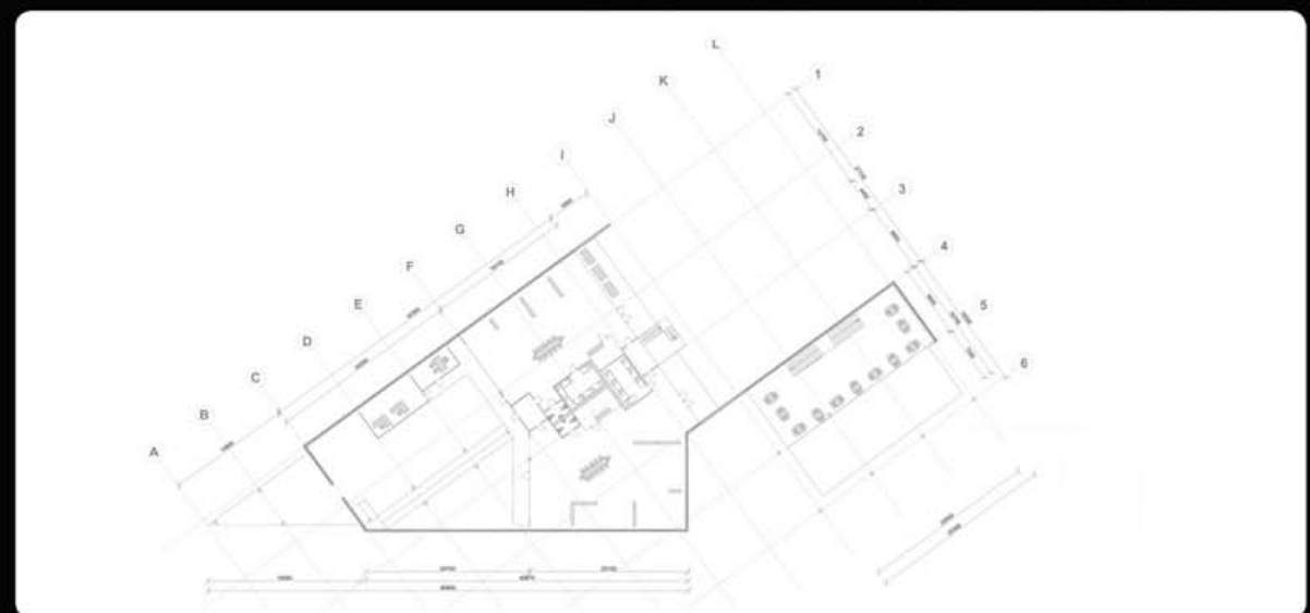
PL.GR. 1E VERDIEPING